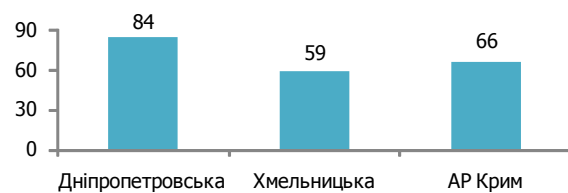
Рис. 1. Частки землевласників, яких інформували про їхні права, %

У підсумку, дві третини землевласників були поінформовані про їхні права щодо земельної ділянки. Джерелом такої інформації були як переважно орендарі, та в меншій мірі представники місцевої влади. Практично не зафіксовано випадків інформування землевласників представниками інших організацій.