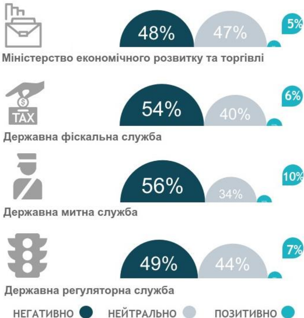
Рис. 3. Оцінка діяльності державних органів

Орієнтація підприємств на зменшення державного втручання в справи бізнесу, через реформи дерегуляції та переведення адміністрування в електронну форму, супроводжується низькою оцінкою діяльності державних органів. Так, більше половини опитаних менеджерів негативно оцінили діяльність митної та фіскальної служб (55,9% та 54,1% відповідно). Також, 48,8% підприємців негативно оцінили діяльність Державної регуляторної служби України, 48,2% - Міністерства економічного розвитку та торгівлі України. Позитивні оцінки зазначеним державним органам дали менше 10% опитаних (найменше – Міністерству економічного розвитку та торгівлі України – лише 4,5% підприємств). Загалом, оцінка діяльності кожного органу є низькою та становить в середньому 1,5 бали, де 1 – негативна оцінка, 3 – позитивна оцінка.