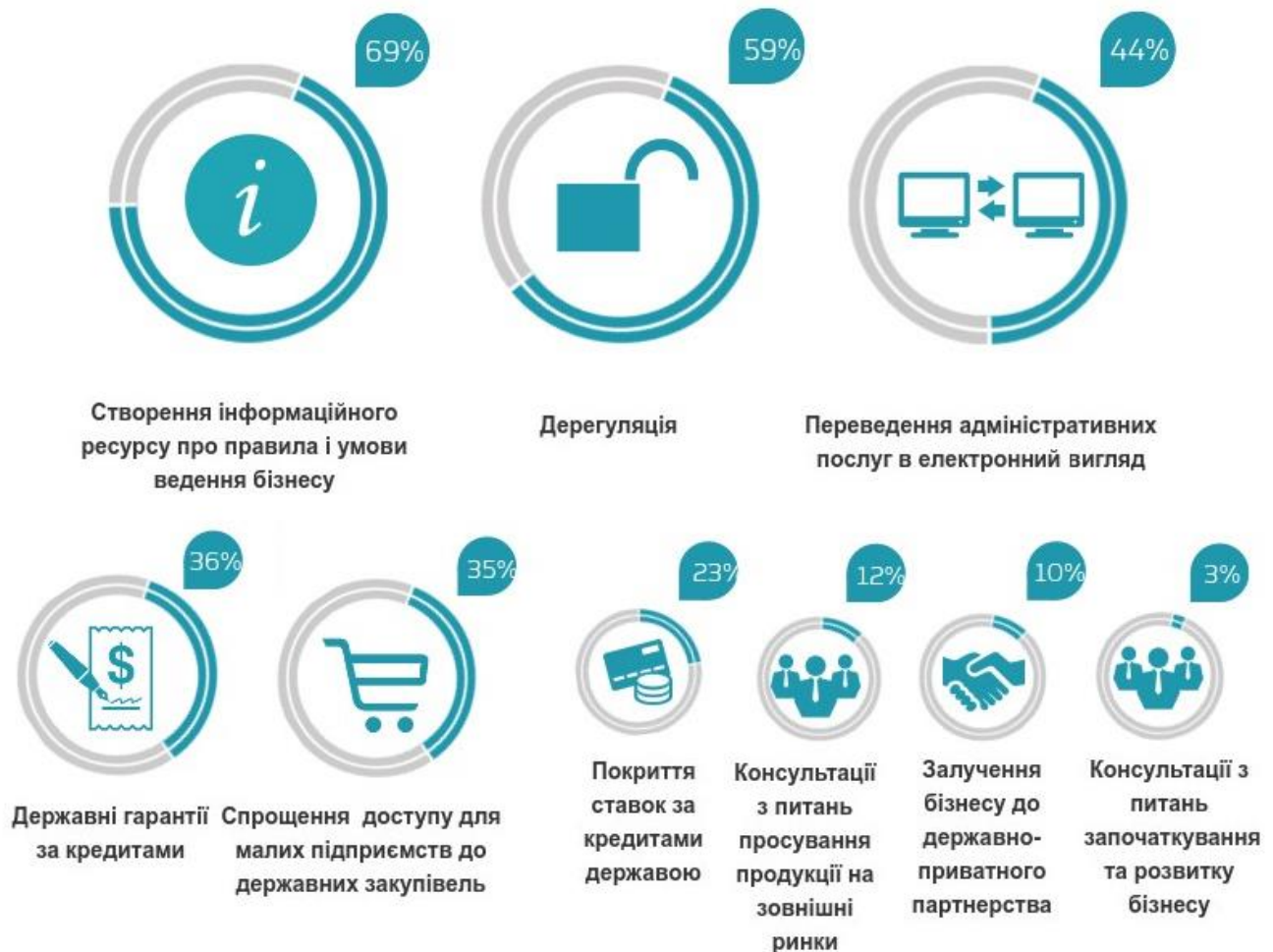
Рис. 1. Оцінка важливості інструментів державної підтримки

В той час як створення загального інформаційного ресурсу про правила ведення бізнесу та дерегуляція однаковою мірою пріоритетні для підприємств різних розмірів, розвиток електронного адміністрування є важливішим для великого та середнього бізнесу (51,9 та 39,5% відповідно). Малі підприємства більшою мірою потребують спрощення доступу до державних закупівель та державних гарантій за кредитами (по 44,7%), тобто залишаються більш залежними від державної політики у фінансовій сфері. На важливості спрощення доступу малих підприємств до державних закупівель також наголошує 38,7% середніх підприємств. Дещо меншою мірою ніж для малого бізнесу, але все ж важливим інструментом державної підтримки для великих підприємств є державні гарантії за кредитами (41,8% опитаних).