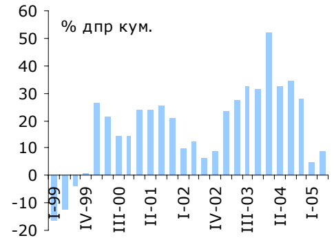
Інвестиції у основний капітал