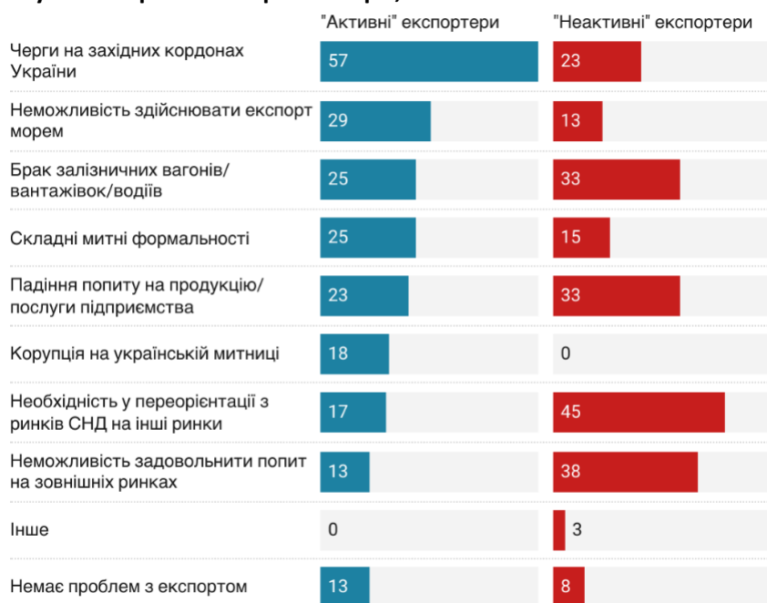
Рисунок 3: Проблеми при експорті, % опитаних